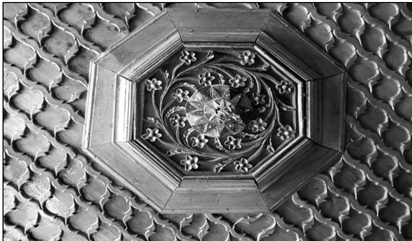
Foto 2. Pamja dekoruese e tavanit.