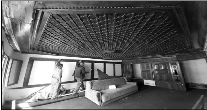
Foto 1. Çmontimi i tavanit