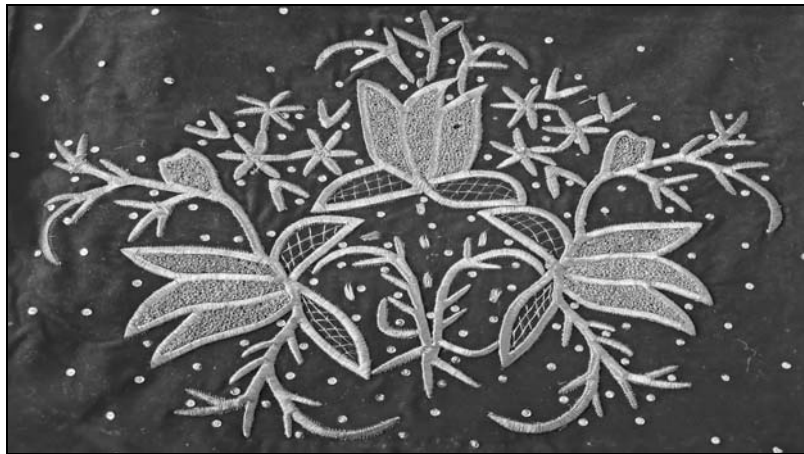
Foto 4. Jastëk i kuq i dekoruar me fije të arit.