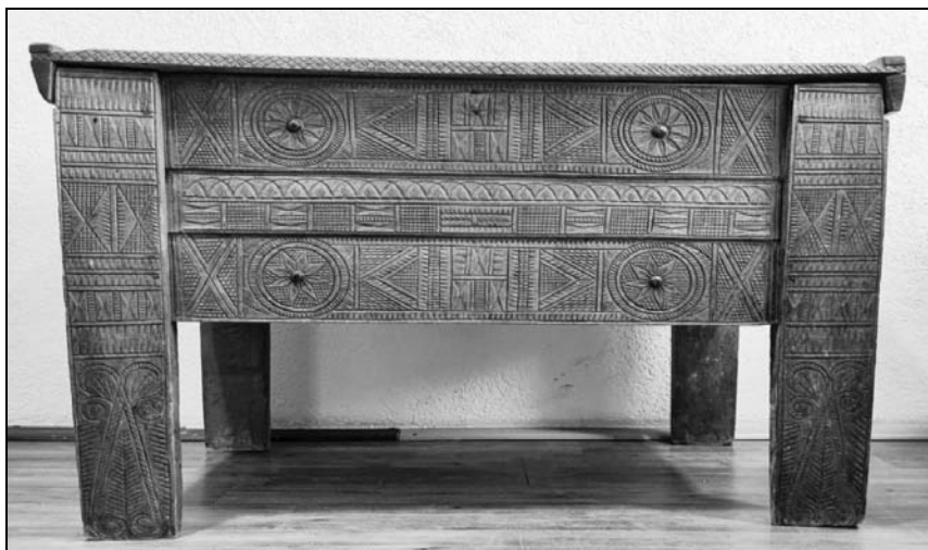
Foto 10. Arti i aplikuar në arkë përmes motiveve gjeometrike.