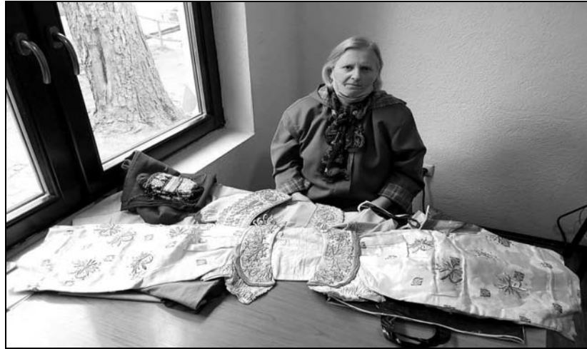
Foto 3. Paja e nuses, kujtim për të kaluarën.

turës dhe trashëgimisë kulturore, duke arritur ta ruaj pajën dhe eksponatet e vjetra të trashëguara nga familja dhe disa të tjera që i kishte mbledhur në vende dhe kohë të ndryshme. Gjatë intervistës, ajo tregon për kohën e kaluar, për punimin dhe përgatitjen e pajës, mënyrën e ruajtjes së eksponateve, por njëkohësisht shpreh gëzimin për dhurimin e pajës muzeut, si dëshirë e kahmotshme, duke u ndier e lehtësuar që tani e tutje institucioni do të merret me ruajtjen, konservimin dhe ekspozimin e tij në ambientet e muzeut, dhe duke mundësuar që gjeneratat e reja, e ato që do vijnë, do të mësojnë për një pjesë të historisë së familjes së saj 22 .