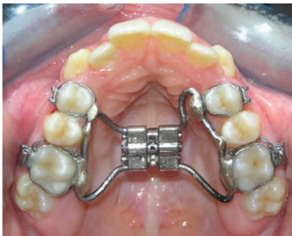
Fig. 1 Zgjeruesi i shpejtë i maksilës