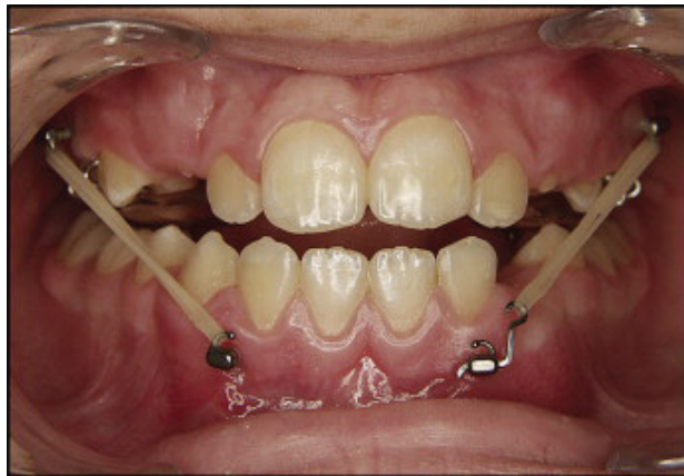
Fig. 4 Llastikët intraoralë me ankorim skeletik

Shfrytëzimi i ankorimit skeletik në klasat III paraqet dy përparësi: 1) mund të përdoret për të minimizuar si ndryshimet dento-alveolare, ashtu edhe rotacionin postero-inferior të mandibulës; 2) me forca të lehta të vazhdueshme të llastikëve të klasës III, tashmë është faktuar se ndryshimet skeletike janë më të mëdha sesa me metodat e tjera, si në maksilë, ashtu edhe në mandibul dhe në ATM. Kjo është metodë trajtimi e re (13), (14), në të cilën llastikët e klasës III vendosen në minipllaka të fiksuara me 3 vida në kreshtën infrazigomatike të maksilës dhe me 2 vida në regjionin e kaninëve në mandibul (Fig. 4). Në fëmijë të vegjël, stabiliteti i ankorimit skeletik është i ulët për shkak të trashësisë dhe densitetit më të ulët kockor në kreshtën infrazigomatike, kështu që mund të mos jetë i mjaftueshëm për një ritencion të mirë mekanik për vidat e osteosintezës. Për këtë arsye, si edhe për shkak riskut të dëmtimit të folikulit të kaninëve inferiorë, këshillohet që ky trajtim të realizohet pas moshës 11 vjeç. Më shumë se intensiteti i lehtë i forcave me llastikët e klasës III, më i rëndësishëm duket se është protokollu që ndiqet: forcat intraorale të vazhdueshme (gjatë gjithë ditës dhe natës) japin një rezultat më të mirë se