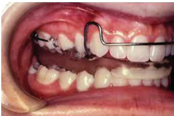
Fig. 2 Bionatori Klasës II

A është e mundur që përshpejtimi i rritjes mandibulare në adoleshencë me këto aparate, të çojë në një mandibul më të madhe në fund të periudhës së rritjes? Përfundimi më i shpeshtë është që periudha e përshpejtitimit gjatë trajtimit ndiqet nga një zvogëlim i rritjes mandibulare më vonë. Kështu që, nëse ka një rritje të gjatësisë mandibulare në terma afatgjatë, ajo është shumë e vogël, rreth 2-3 mm. Të dhënat janë kontradiktore, por ato në përgjithësi nuk mbështesin idenë që ortodonti “rrit mandibulat” e pacientëve.