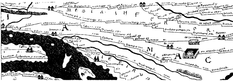
Fig. 1. Tabula Peutingeriana

Rruga Lissus-Naissus e cila përshkonte trevën verilindore të Shqipërisë me nisje nga Lisi (Lezha) duke vijuar buzë derdhjes së Drinit del në Rrafshin e Dukagjinit e të Kosovës dhe vijon kah Podujeva, Kurshumlia, afër Prokuplës e Brestovicës dhe lidhet me Nishin. Kjo hapësirë gjeografike e pasur me minerale si bakër, krom, hekur etj., ishte e një rëndësie të veçantë për popullatën e atyre anëve. Më poshtë po e paraqesim “Tabula Peutingeriana” – Miller IR., col. 525- 559 për të parë se si ka qenë pasqyruar grafiki itinerari i rrugës Lissus- Naissus: